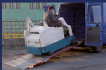
Empresas de limpieza