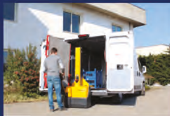
Entregas de pallets