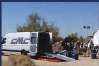
Eventos y alquiler