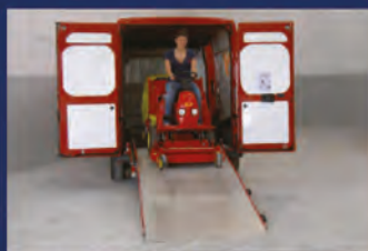
Maquinaria de jardinería